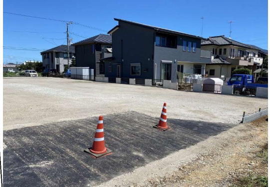
電気水道使えます。監視カメラあり！